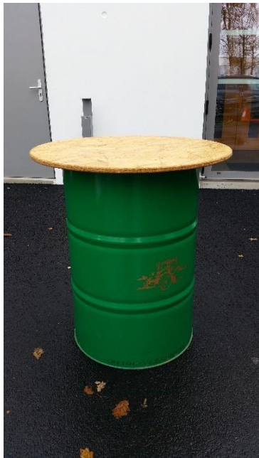
Mange debout quantité 9