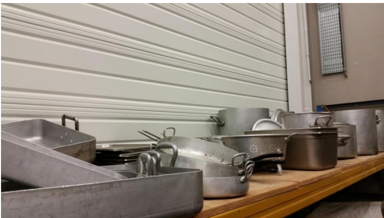
Faitouts / Plats / Accessoires...