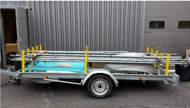
Stand 7 X 8 Mètres