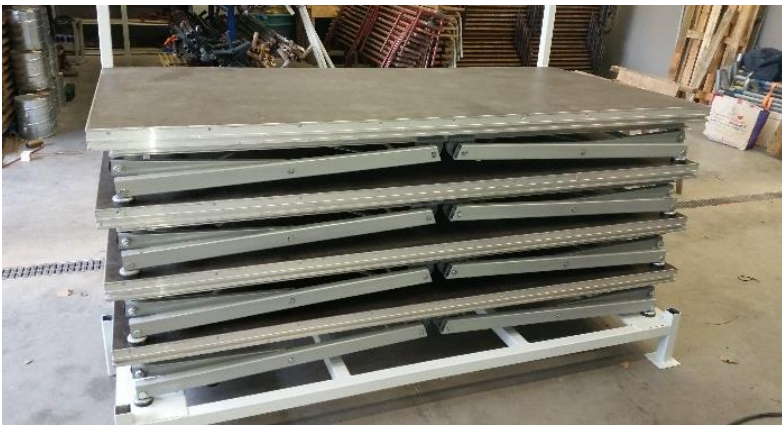
Podiums 12 plateaux 2M 2 chacun Pour une scène de 24 M 2