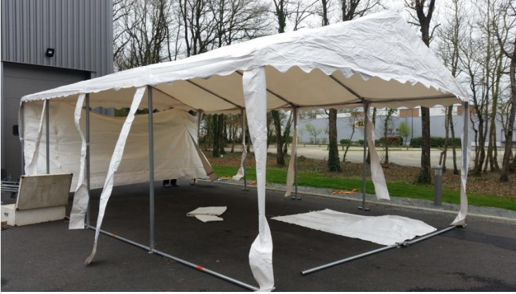
Stand 5 X 8 Mètres