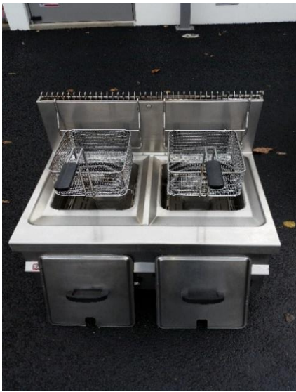
Friteuse Gaz 2 bacs 2X10 Litres