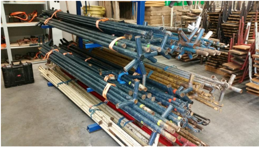
Stands 3 X 6 M Qté 15