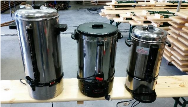
1 Percolateurs 100 tasses et 2 percolateurs 50 tasses