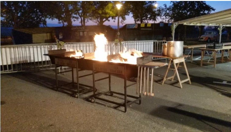
Barbecue Comité des Fêtes