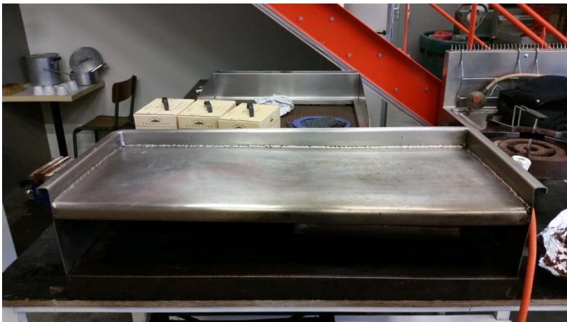
2 Grills viande Inox