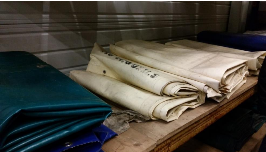
Bâches pour stand 3 X 6 Mètre