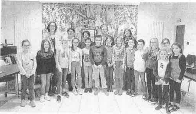
La première réunion des quinze membres du conseil municipal des enfants a été l'occasion de rencontrer le maire, Dominique Paquereau.