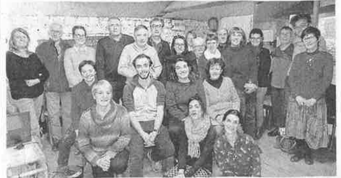
L'assemblée générale s'est déroulée en présence d'une grande partie des adhérents