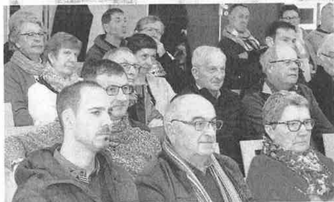
Les Brouziliens sont venus nombreux à la traditionnelle cérémonie des vœux.

Vœux : de nombreux projets pour l'année 2019