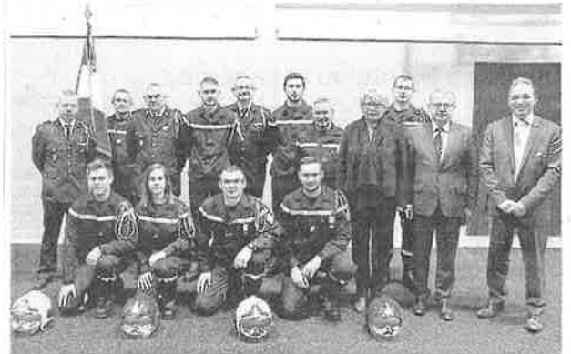
En présence des élus, les promus et médaillés de la Sainte-Barbe.