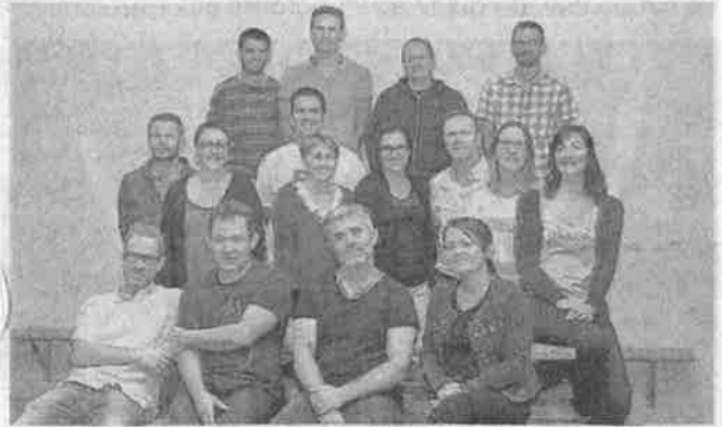
Les membres de la commission foire et responsables de stands, réunis pour une dernière réunion de préparation.

Au cours de l'après-midi, ce dernier a aussi présenté l'expo aux élèves de CM1 et CM2 des écoles Pierre Monnereau et des Tilleuls.