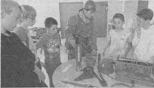
Des élèves très intéressés par les objets et la tenue portée par le soldat lors de la guerre 1914-1918.

À l'occasion du centenaire de la fin de la Première Guerre mondiale, une exposition était organisée, jeudi, au collège Notre-Dame de l'Espérance avec l'aide de l'UNC locale (Union nationale des combattants) et l'ASPB (association de sauvegarde du patrimoine brouzillien). En visite libre sur le temps du midi, les élèves ont pu découvrir différents panneaux préparés par les deux associations, des documents anciens, des objets divers ainsi que des maquettes confec-