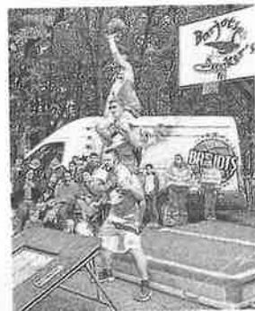
Le public a su apprécier le spectacle des Barjots Dunkers.

Côté chiffres, 1 500 repas ont été préparés, 1,6 tonne de moquette vendue et 150 kg de moquette cuits dans les marmites disposées autour du feu de bois. Les bénéfices de la journée vont servir aux investissements et aux